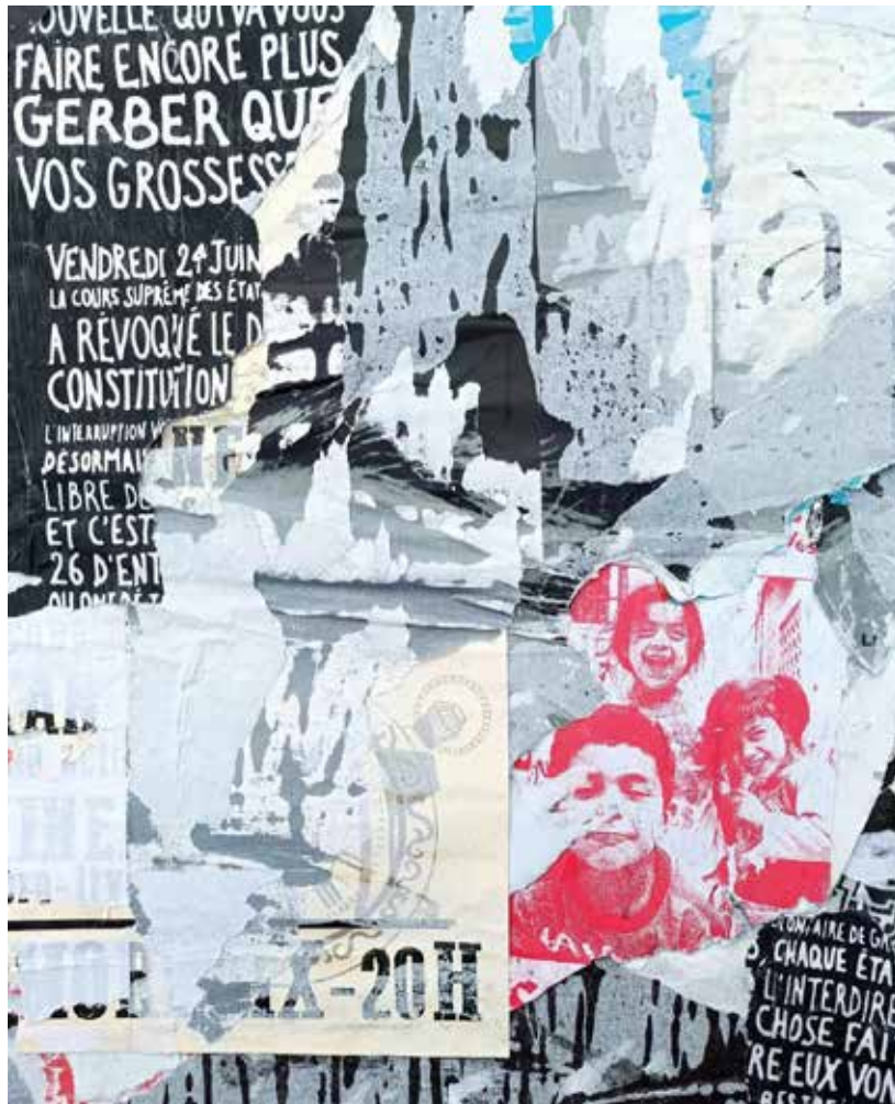
LIBERTÉ Collage 30x40 cm 2023