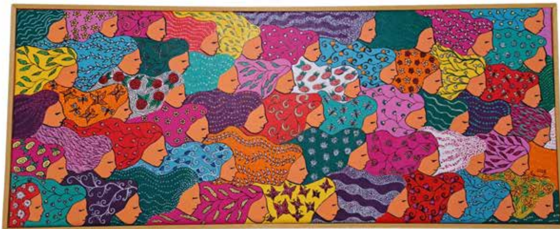
MOTHERS OF NATURE Acrylic and ink on canvas 51,3x21,2 cm 2022