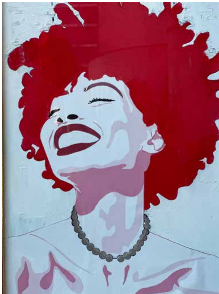
SOTTO LA SUPERFICIE Acrilico, carta, matita e olio 50x70 cm 2024