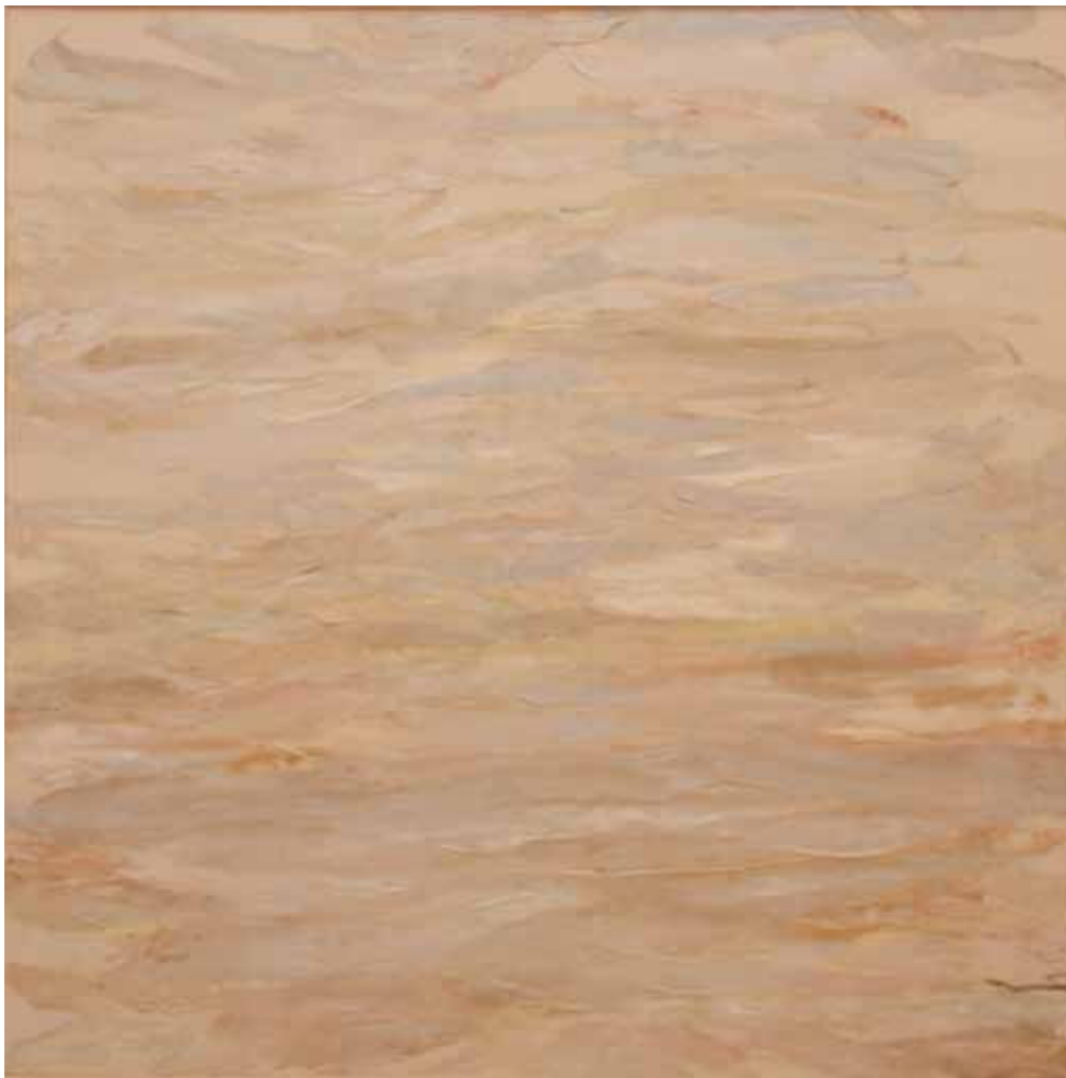
FOCUSED Oil Pastel, Acrylic 100x100 cm 2024