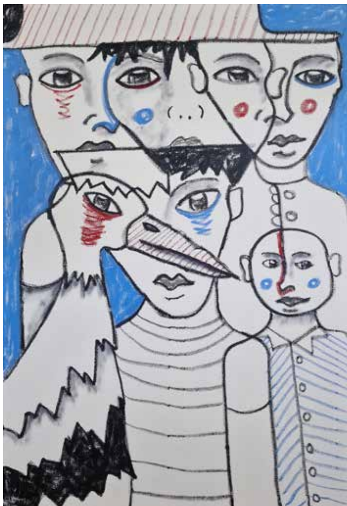
THE STORK Oil chalk on canvas 100x70 cm 2024