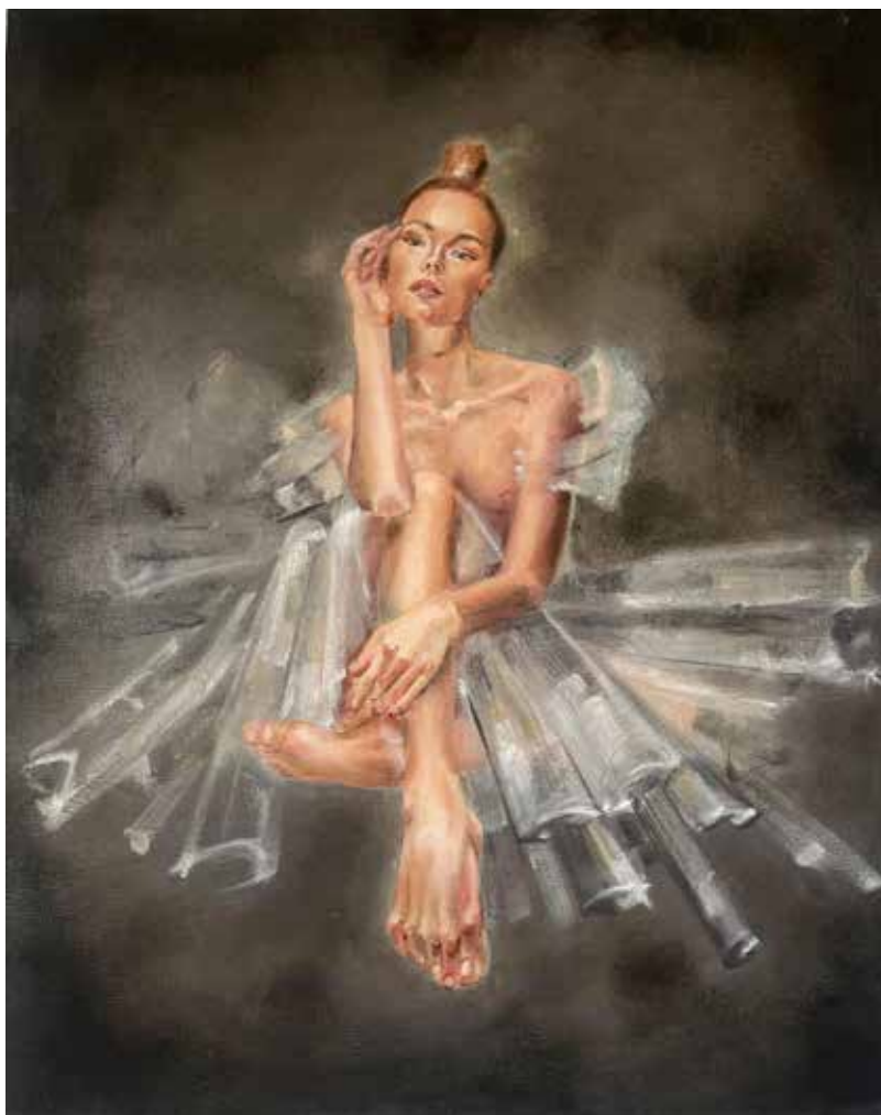
NOSTALGIA Oil on canvas 60x70 cm 2023